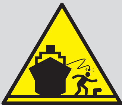
Peligro: caída de sirga.